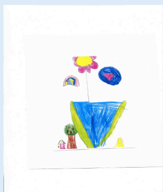
Dessin (fille 5 ans)