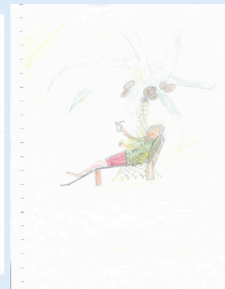
Le bonheur sur un transat, sous un cocotier (garçon 9,6 ans)