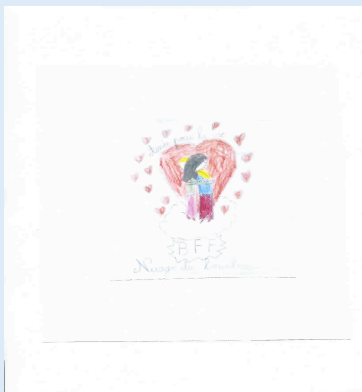
Nuage de bonheur, amies pour la vie (fille 7,6 ans)