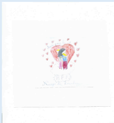
Nuage de bonheur, amies pour la vie (fille 7,6 ans)