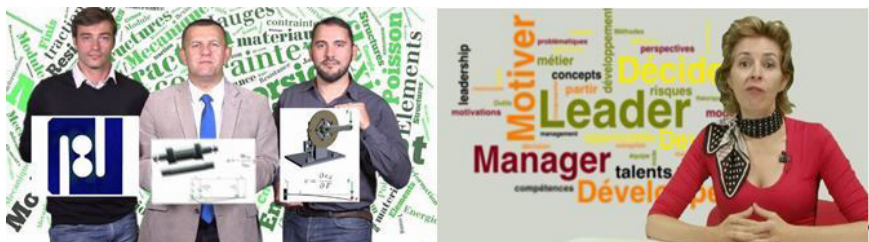
Fonte: Apresentação dos MOOC FUN

num mosaico estético no qual os mais frequentes aparecem em letras gordas. Das ferramentas de visualização linguística, passámos, hoje em dia, à criação de cartazes de ocorrências através da seleção dos que queremos ver destacados em letras gordas. Estas possibilidades tornaram-se, assim, um potencial cerimonial para o actante segundo.