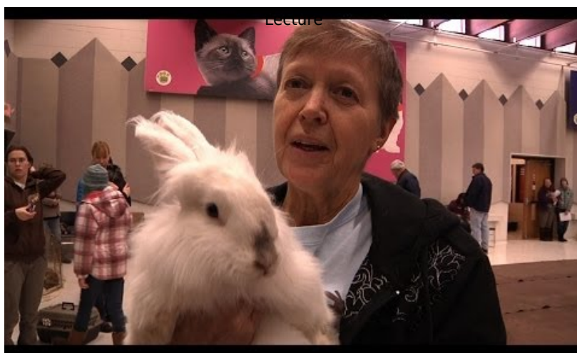
Vidéo 6 North Metro TV, 2014. Hot, Jump and Play. A Rabbit Agility Documentary (15' 57") (consultée le 13 novembre 2018).